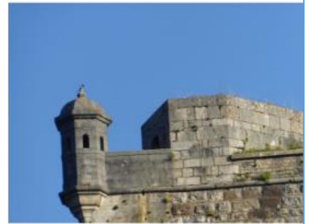
BESANCON (JURA FRANCIJA)